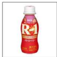
明治プロバイオヨーグルトR-1ドリンク