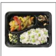
医師監修ヘルシー 弁当