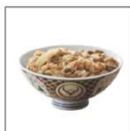
吉野家ミニ牛丼の具