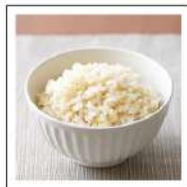
ごはん(玄米)【無添加】