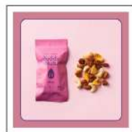
ミックスナッツ (Buddy Nuts)