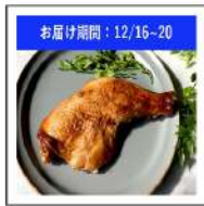
季節限定商品D(や さい)