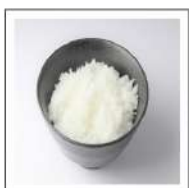
ごはん(白米)【無添加】