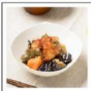
お肉料理(鶏肉メニュー)【無添加】