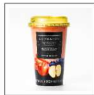
レッドスムージー