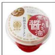
レンジ調理ラーメン