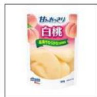
シロップ入りフル ーツ