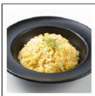
ごはん(和食・中華)