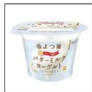
カップヨーグルト