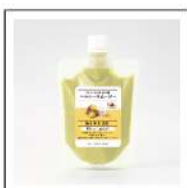
レンジでチンして食べるスムージー