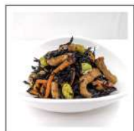
副菜(野菜料理)【無添加】