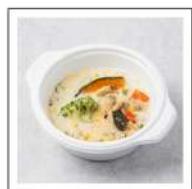
具たくさんスープ