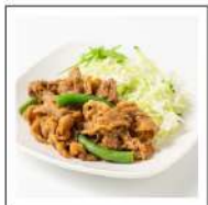
お肉料理(牛肉メニュー)【無添加】