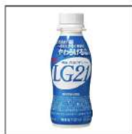
明治プロバイオヨーグルトLG21ドリンク