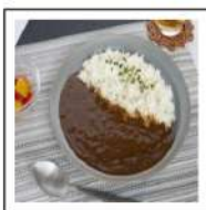
カレー類(1)(ビーフカレー)