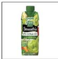
グリーンスムージー