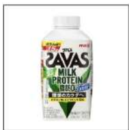
SAVASザバス ミルクプロテイン