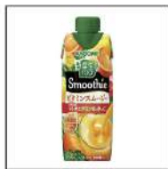
イエロースムージー