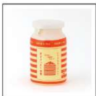
カップヨーグルト (大)