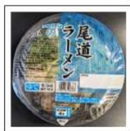
ラーメン・ちゃんぽん・冷やし麺(チルド)