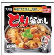
ごはん・具材セット