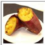
焼き芋(冷凍)【無添加】