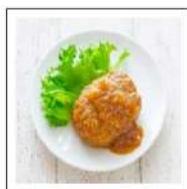
肉惣菜(ハンバーグ)