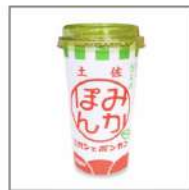
フルーツジュース