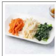
レンジでチンして食べる温野菜サラダ【無添加】