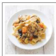
肉惣菜(牛・豚肉料理)