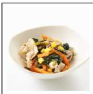
お肉料理(豚肉メニュー)