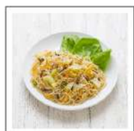
ピーフン・チャプチェ