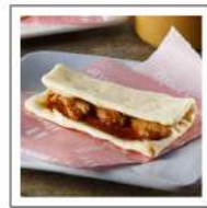
パーソナルスナッ ク